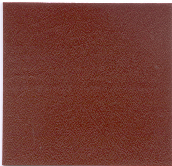
FL30 Red Wine