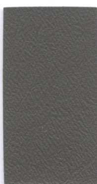
FL28 Gull Grey