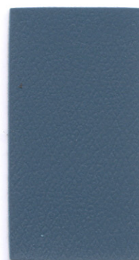
PA11 Colonial Blue